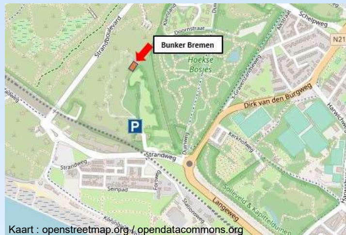
Kaart : openstreetmap.org / opendatacommons.org